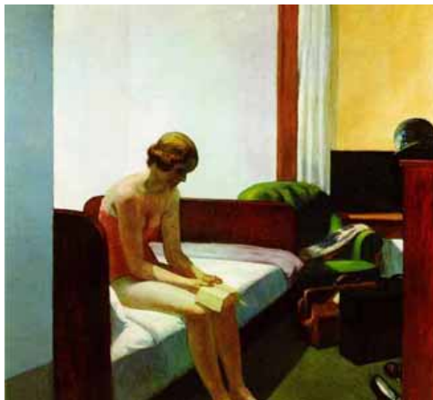
Edward HOPPER, Hotel Room.

1. Imagine qui est cette femme, qui lui a écrit, ce qu'on lui a écrit, ce qu'elle va répondre et la suite.