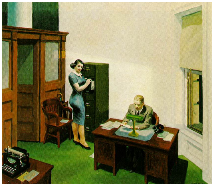
Edward HOPPER, Office night

2. Cette mère correspond par mail. A qui écrit-elle ? Qu'écrit-elle ? Que lui répondra son interlocuteur ?