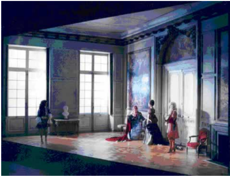
Mise en scène de Gildas Bourdet- Théâtre de la Salamandre (1979) : http://www.guittier.net/album2.htm