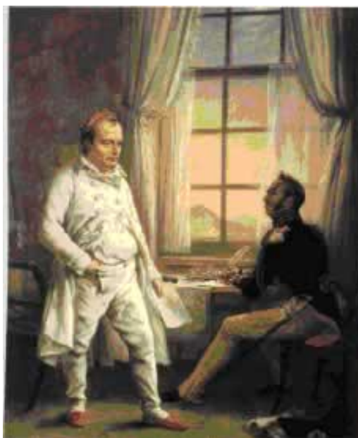
"L'empereur à Sainte-Hélène dictant ses mémoires au général Gourgaud par Karl August von Steuben