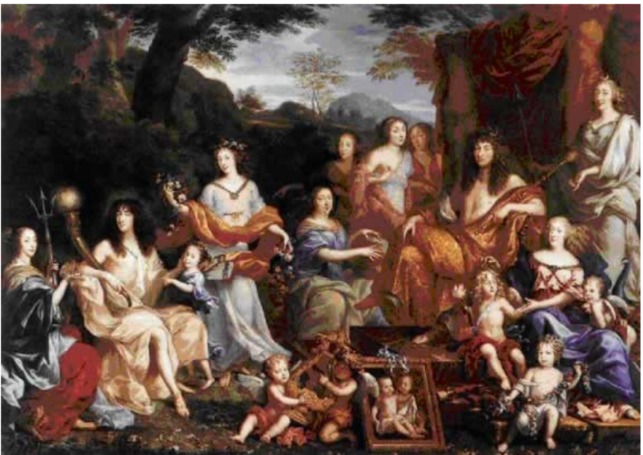
La Famille de Louis XIV en 1670 représentés en travestis mythologiques de Jean Nocret