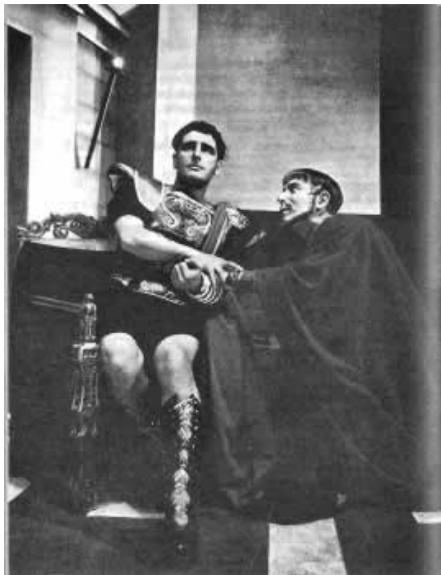
Comédie française (1948)