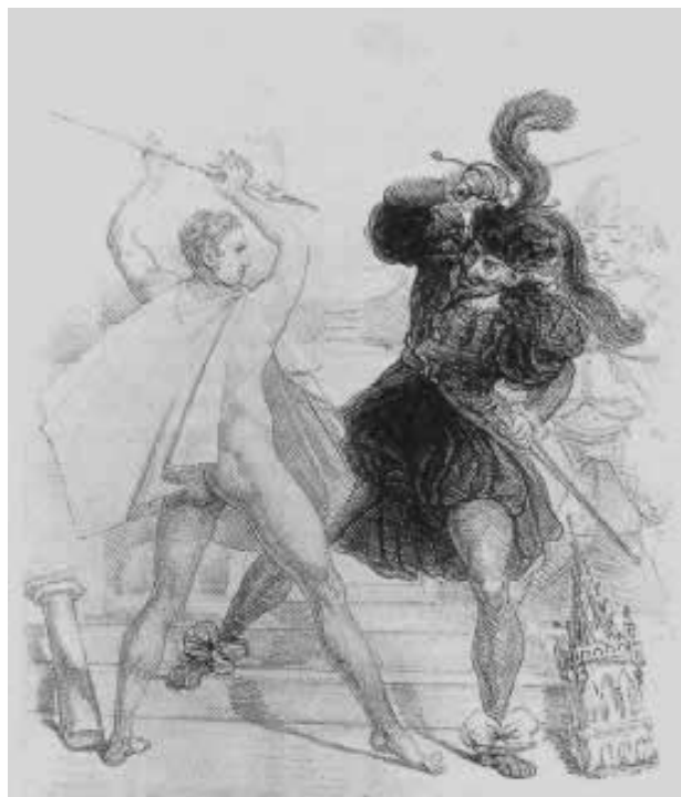
Salon de 1827

En utilisant toutes les informations que vous avez réunies au cours de cette séquence, expliquez le dessin. Vous illustrerez votre explication d'exemples concrets.