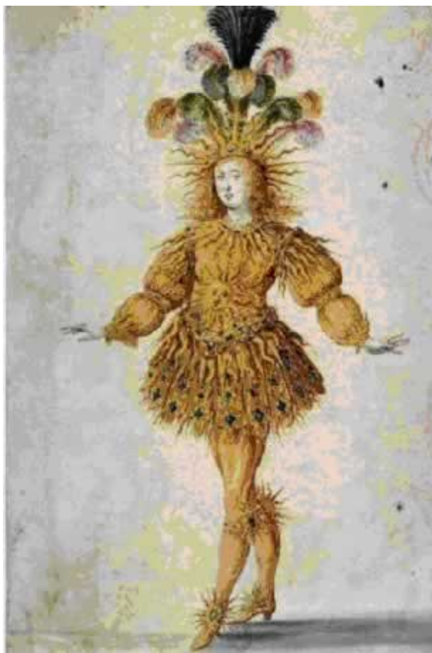
Louis XIV en soleil, costume du ballet La Nuit